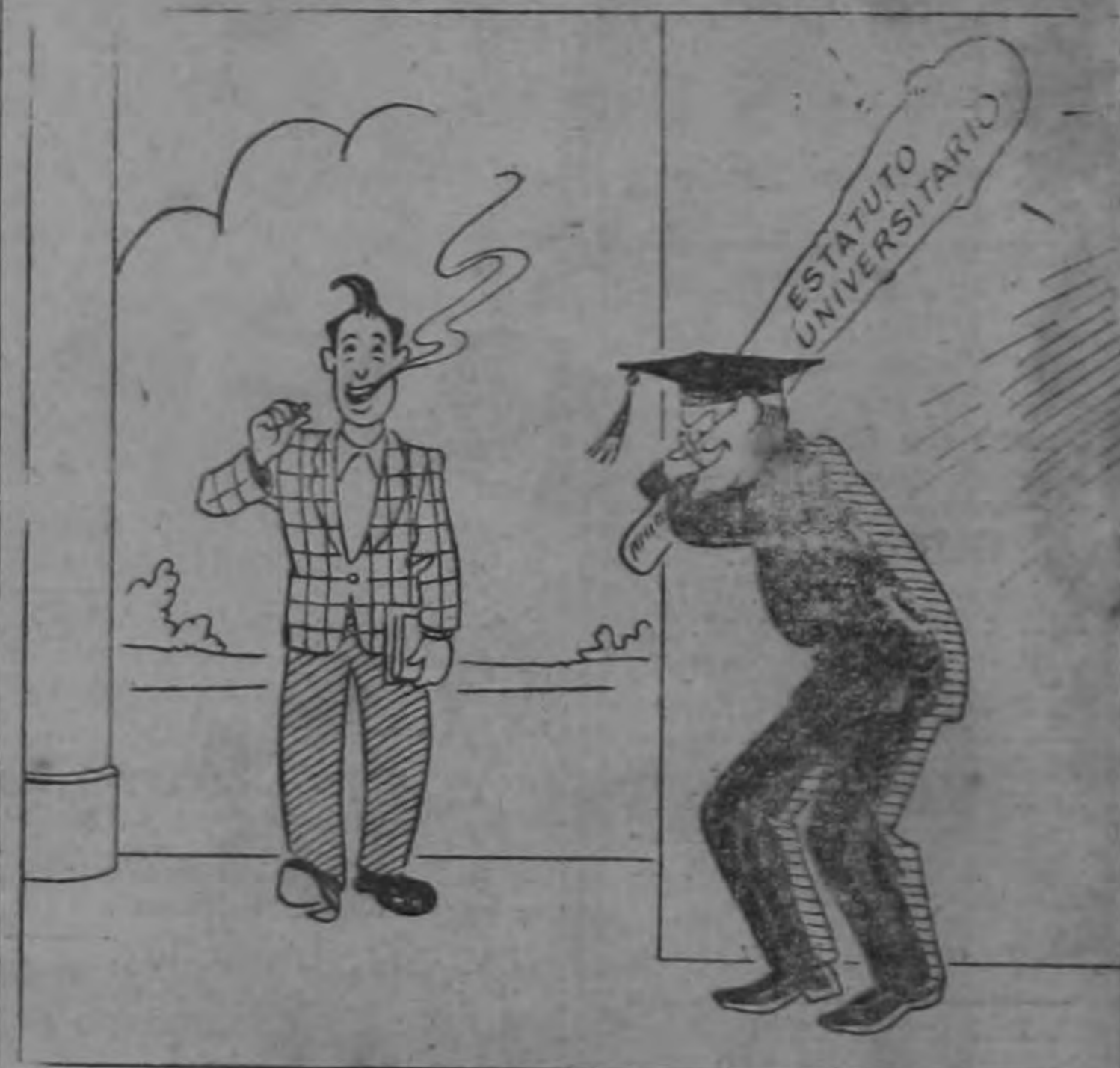
Los estudiantes al regresar de las vacaciones de medio periodo, alegres y confiados, se encontraron con que había sido promulgado un Estatuto Universitario que más parece un Reglamento de un campo de concentración. (Su autor: F. Baudrit)