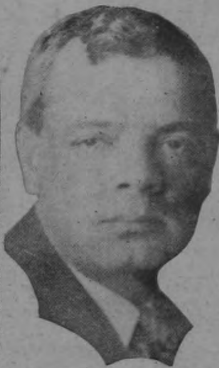
¡QUE VIEJO MAS FEO!