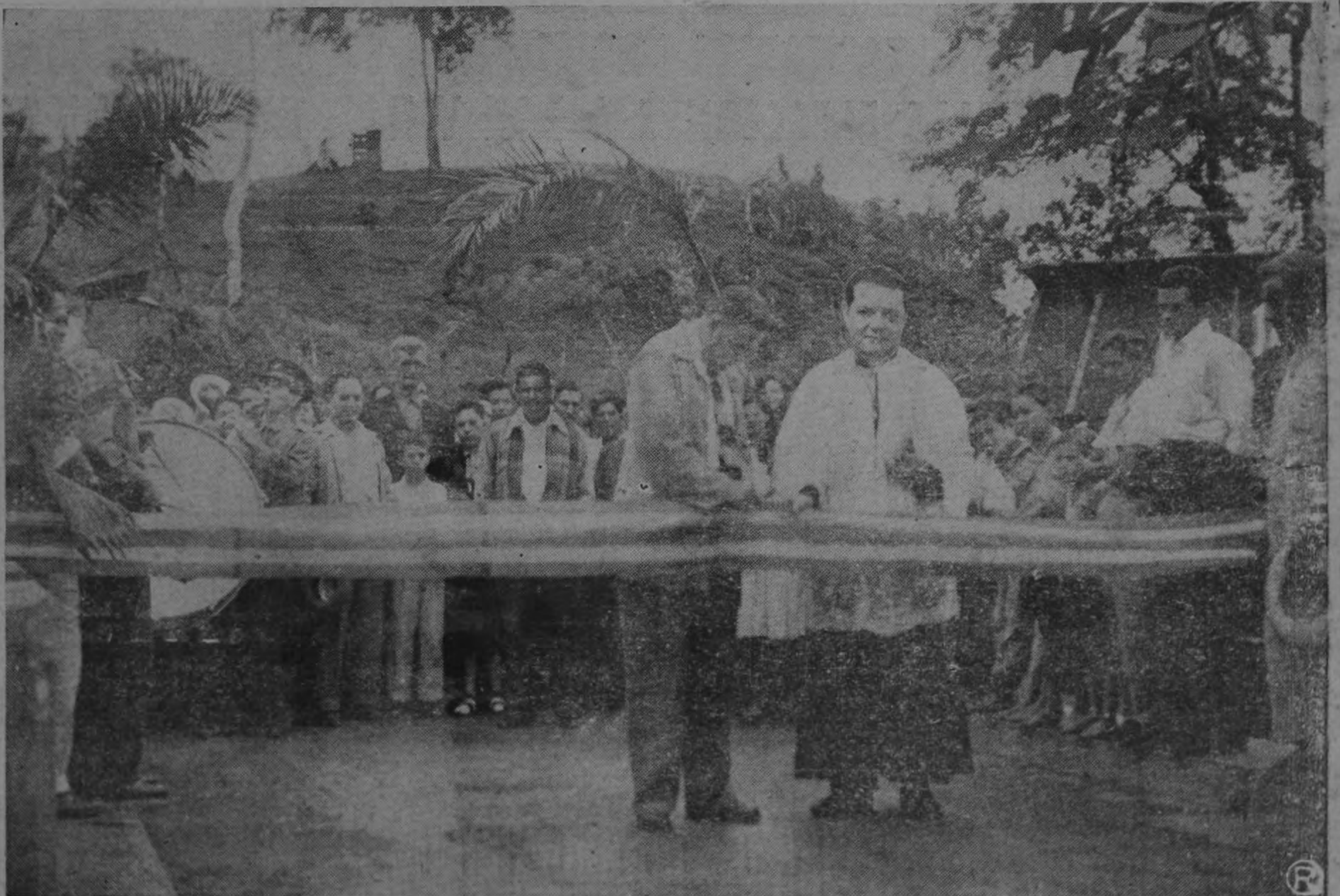
INAUGURACION DOMINICAL.—El presidente Ulate corta la Cinta simbólica que separa la colle del primer chinomo del turno de Cuajiniquil de Dos Ríos, mientras el Párroco Martínez Moreno lo asiste y don Fernando Baudrit, como siempre, le suena el bombo.